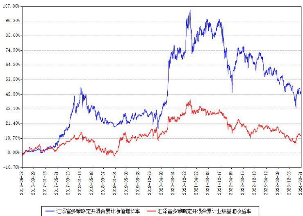
汇添富多策略定开混合累计净值增长率与同期业绩基准收益率对比图